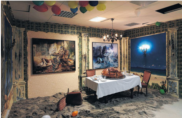
De eetkamer met opgediend lijk maakt deel uit van de installatie Bio-Shock van Artist Anonymous.

Het gebeurt niet vaak dat de etalage van een galerie voor hedendaagse kunst zo gretig bestudeerd wordt door kleine kinderen. Vrijwel elke vier- tot achtjarige passant drukt zijn neusje tegen het glas van Galerie Ron Mandos aan de Prinsengracht. Daarachter openbaart zich inderdaad een feest voor de homo ludens. Een enorm bouwset van playmobil, dat onderin begint als een middeleeuws kasteel en via een stam met klimmende riddertjes uitmondt in een staketsel van beesten en poppetjes.